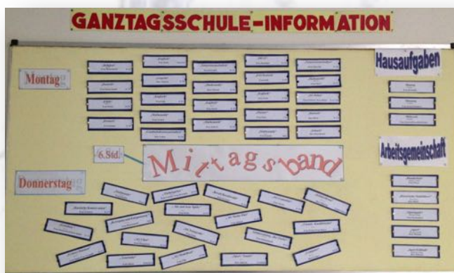
Ganztagschule - Infotafel