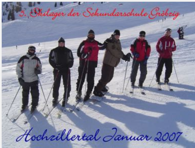
Skilager mit Tradition

Auf einige Traditionen, die sich an unserer Schule zur Gestaltung des Schullebens entwickelt haben sind wir besonders stolz: